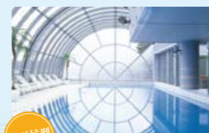
全天候型 プリンセス有馬