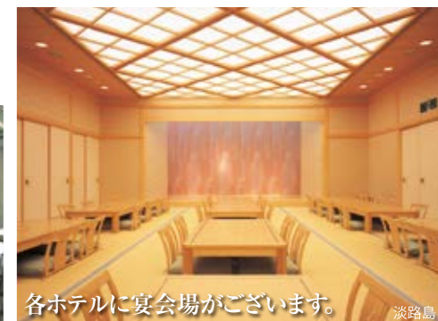
各ホテルに宴会場がございます。