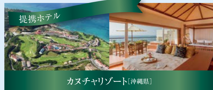
カスチャリゾート[沖縄県]