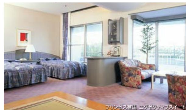
プリンセス有馬 エグゼクティブスイート

※お申込順でご予約いただいておりますので、すでにご予約がある場合はご了承ください。※特別室のご利用には別途料金が必要です。