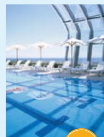
エレガント淡路島 全天候型