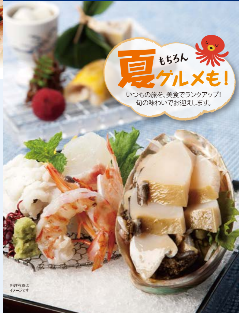
料理写真はイメージです