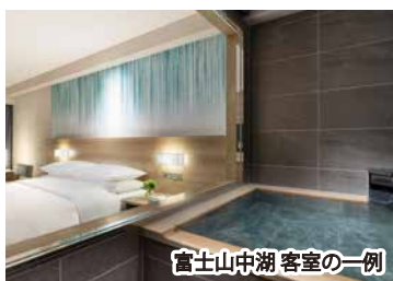
富士山中湖 客室の一例