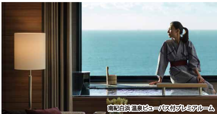
南紀白浜温泉ビューバス付プレミアムルーム

彩りあふれる風景と味覚を堪能する「秋の旅」に出かけませんか。 旬の食材を使ったお料理と温泉付客室での滞在をお楽しみください。