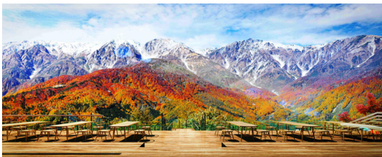
HAKUBA MOUNTAIN HARBOR (営業期間~11/10迄)