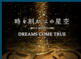
時を刻むこの星空 with DREAMS COME TRUE