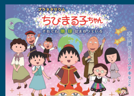
ちびまる子ちゃん それでも地球はまわっている