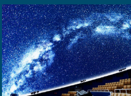
ネイチャーリウム オーロラの調べ 神秘の光を探る

※日程により上映のないプログラムもございますので、上映スケジュールは必ず事前にご確認ください。