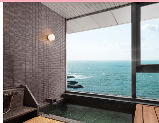
名湯・白浜温泉の湯を楽しめる貸切温泉風呂