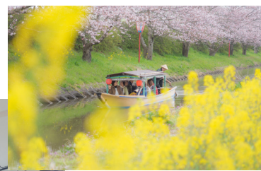
近江八幡水郷めぐり (春のイメージ) ※営業日等は事前にご確認ください。