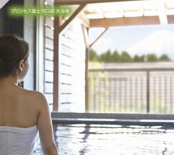
プリンセス富士河口湖 大浴場