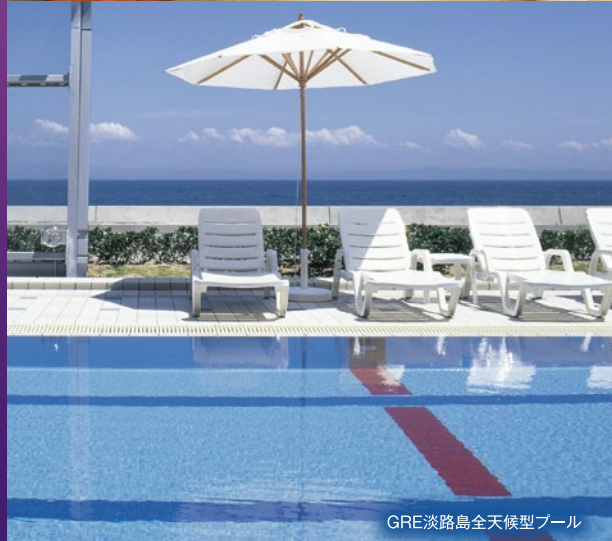
GRE淡路島全天候型プール